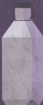
قمقمه‌ی پُر از آب