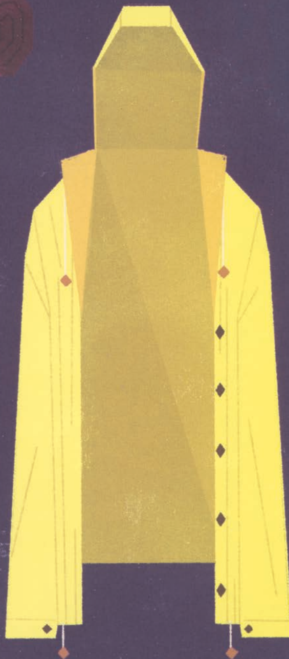
کاپشن ضد آب